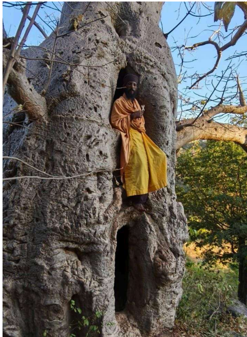
Photo de moine dendrite prise en janvier 2025