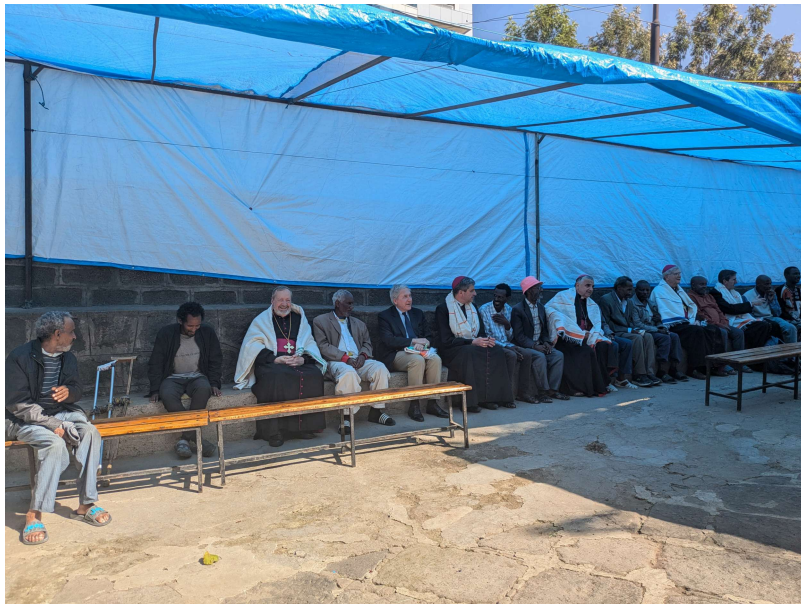
Photo des personnes accueillies au centre Voluntas Dei (avec la délégation des évêques de France)

Dès notre première visite dans ce centre, nous avons été profondément touchés par la fragilité des personnes accueillies, mais aussi par la bienveillance et la douceur avec lesquelles le centre et ses responsables accueillent les personnes de la rue. Depuis 6 ans, ce centre est principalement soutenu par L'Œuvre d'Orient. Enfin, nous sommes convaincus que le Christ se rend visible à travers ces personnes accueillies, au point d'y avoir emmené la délégation des évêques de France pour visiter cette mission.